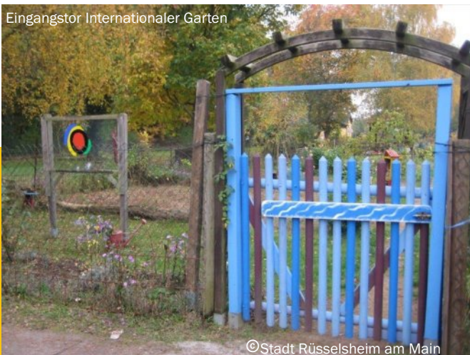
Eingangstor Internationaler Garten

Veranstalter: Internationaler Garten e. V.